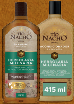
HERBOLARIA Caída del pelo